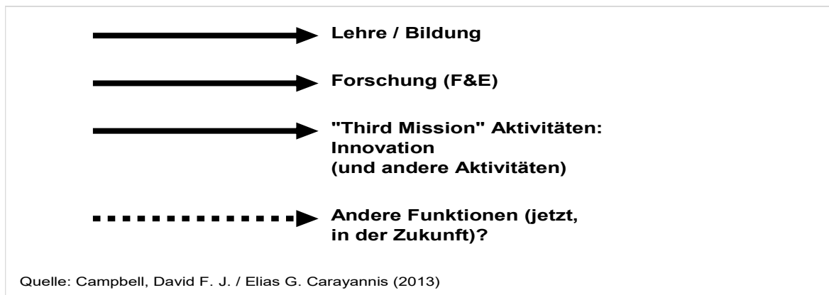
Abbildung 1. Das funktionale Profil von Hochschulen (Universitäten, Hochschulinstitutionen, HEI)

Ausgehend von der obigen Fragestellung gliedert sich der vorliegende Beitrag in folgende Abschnitte: In Abschnitt 2 werden Ansätze zur Konzeption von Innovation an Hochschulen (Universitäten) dargelegt, Abschnitt 3 geht dann kurz auch auf die digitale Transformation an Universitäten ein. Vor diesem Hintergrund zeigt Abschnitt 4 unterschiedliche Beispiele für die Planung von Innovation – auf strategischer Ebene – an ausgewählten Universitäten in Österreich. Angesichts dieser Vorhaben bzw. Entwicklungen geht Abschnitt 5 auf die aktuelle Governance, das heißt auf die strategischen Überlegungen auf Ebene der Hochschulpolitik, ein und leitet zur Frage über, welche Rahmenbedingungen es für ein „Mehr“ an Innovation im Hochschulsystem braucht. Abschnitt 6 fasst schließlich unsere Überlegungen zusammen.